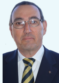
Yves KERKOVE Gouverneur