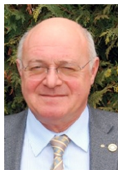
Pierre WEILL Gouverneur